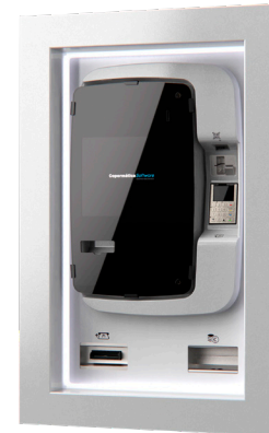
autoPOS Future Glass

El sistema de identificación de matrículas nubbix LPR mediante las cámaras IP de Axis, aporta transparencia, y seguridad al cliente y sus flotas. Con este sistema se identifica al cliente mediante su matrícula, y de esta forma aplica las políticas comerciales y de fidelización que cada cliente disponga, de manera ágil, rápida y eficaz.