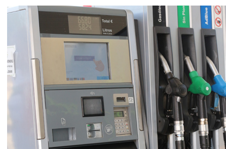
autoPOS integrado en Gilbarco